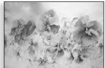
Une oeuvre signée Violette Vergely

J usqu'au 2 juillet, la Bibliothèque municipale de Porto Vecchio fait place aux aquarelles de Violette Vergely qui sont donc visibles du mardi au vendredi de 9h à 12h et de 14h à 18h, le lundi de 14h à 18h et le samedi de 9h à 12h, avec un vernissage prévu le 20 juin à 19h.