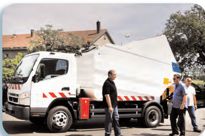
Le nouveau type de véhicule

distribué à son tour, ainsi qu'un sac cabas de pré-collecte sur lequel figureront les consignes de tri.