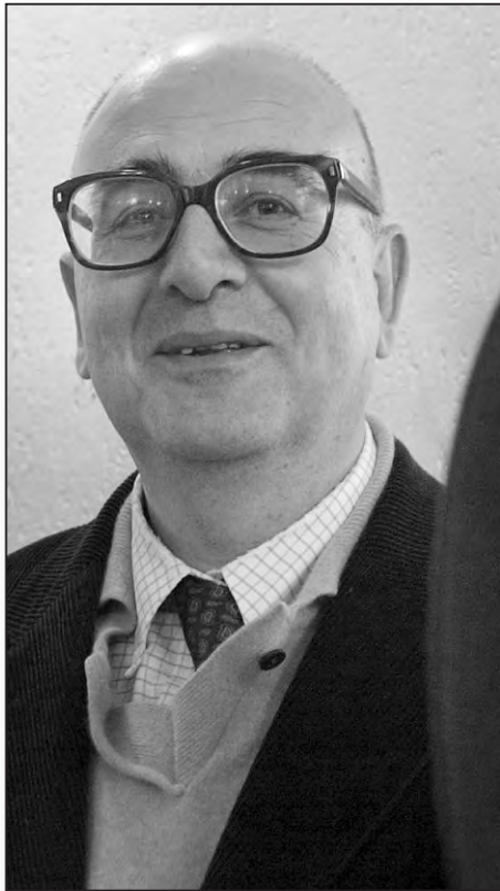
Me Trani apporte sa pierre au débat sur le foncier

Après enquête, un commissaire enquêteur, dans le délai d'un mois, transmet son rapport au Président du Conseil Général qui décide alors d'ordonner ou non les opérations envisagées et d'en déterminer le périmètre par une publication faisant l'objet d'une publicité réglementée par les dispositions de l'Article R 121-23 du Code Rural, l'autorité préfectorale disposant d'un pouvoir de contrôle.