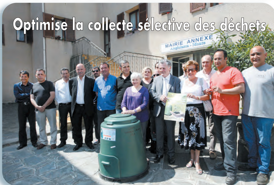
Devant la mairie de Monte autour du président Joseph Galletti